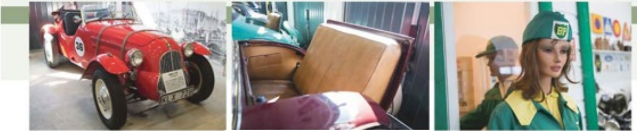
TÄVLINGSBIL. BMW 1936, 319 Special var en framgångsrik tävlingsbil med sin 6-cylindriga toppventilmotor på 1971 cc.